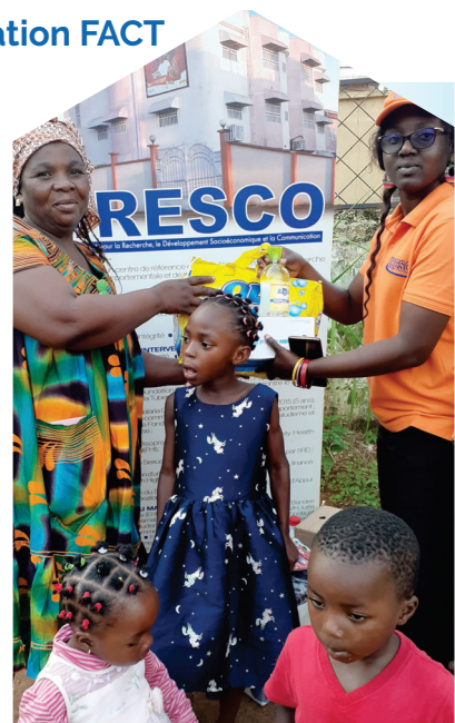
Remise des dons à la responsable de la Fondation FACT

Par un commun accord, les adolescents de la FACT ont désormais un slogan « Le sexe ça peut attendre... Mon avenir d'abord ».