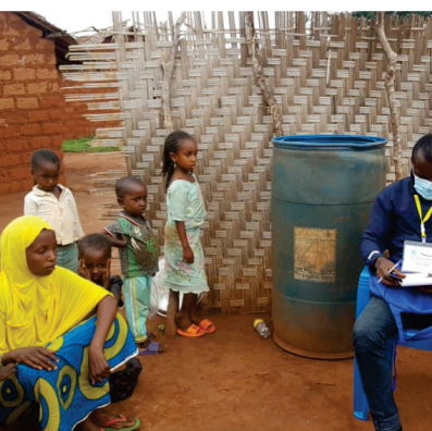
Administration du questionnaire à une famille bénéficiaire à Woumbou

Le Post Distribution Monitoring Survey ou Enquête de Suivi Post Monitoring Distribution vise à évaluer la sécurité et l'effectivité de l'accès à l'assistance alimentaire et autres commodités fournies par le PAM aux ménages dans des camps de réfugiés et sites de déplacés internes nés des crises socio-politiques dans les pays voisins (Nigeria et RCA) et au Cameroun.