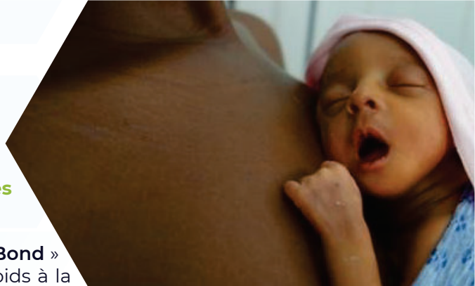
Méthode Mère Kangourou

Le Projet « Cameroon New Born Development Impact Bond » vise à sauver et améliorer la vie des enfants de petits poids à la naissance ( \leq 2000g ) et des enfants nés prématurés ( < 37 semaines) au Cameroun. Bien qu'il existe des méthodes classiques permettant aussi bien de sauver ces nourrissons, la Méthode Mère Kangourou (MMK) est une offre de services alternative qui s'adapte aisément aussi bien aux capacités techniques de nos hôpitaux qu'aux capacités financières des parents. La MMK consiste en un contact peau-à-peau continu entre la mère et le nouveau-né, tout en encourageant l'allaitement maternel ainsi qu'une sortie d'hôpital appropriée et un suivi rapproché. Le mandat d'IRESKO est de statuer sur la capacité et, partant, la qualité de la mise en œuvre des programmes/Méthodes Mère Kangourou par les hôpitaux retenus pour implémenter cette méthode à titre pilote.