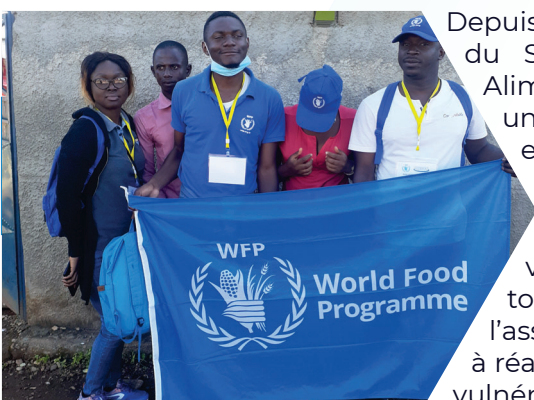
Equipe des agents enquêteurs

Depuis le début de la crise sociopolitique dans les régions du Nord-Ouest et du Sud-Ouest du Cameroun en septembre 2016, le Programme Alimentaire Mondial a été un allié salutaire de la population fournissant une assistance alimentaire dans la plupart des localités sinistrées tout en veillant à ce que les plus vulnérables soient ciblés et aidés à améliorer leur alimentation et état nutritionnel.