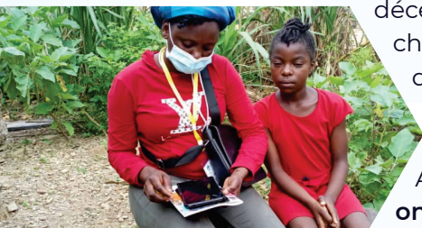
Entretien avec la jeune fille au Littoral

La collecte de données (quantitative) pour cette étude a été réalisée du 27 septembre au 22 décembre 2021 par une équipe de 27 personnes dont 18 enquêtrices et 9 chefs d'équipes qui ont préalablement été formées à la collecte des données. Elle ciblait les filles âgées de 8 à 15 ans et les mères ayant au moins une fille âgée de 8 à 15 ans.