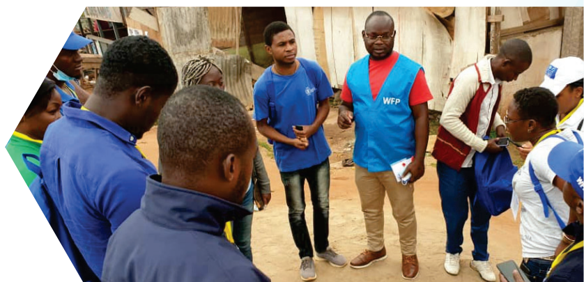
Concertation des agents enquêteurs à Garoua-Boulai

Les résultats des enquêtes réalisées au cours de l'année 2021 sont présentés dans le tableau sous dessous :