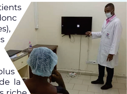
Vérification de la qualité de chirurgie de la cataracte