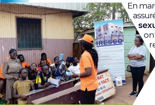
Sensibilisation des adolescent(e)s sur la santé sexuelle