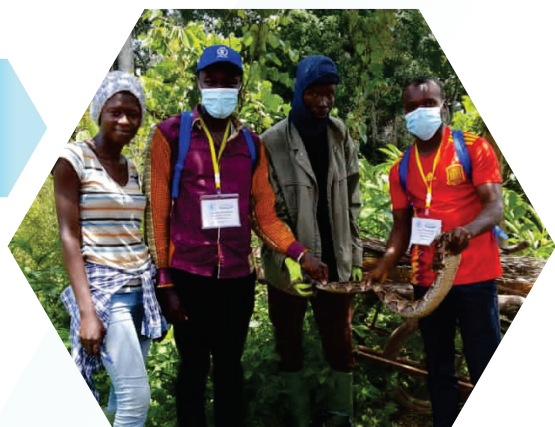
Bénéficiaires et agents enquêteurs dans le champ communautaire à Zembe Borongo

Trois ronds de PDM réalisés en 2021 (avril, juillet et septembre) auront permis de fournir au PAM et à ses partenaires, des informations pertinentes sur la mise en œuvre des activités de Distribution Générale des Vivres (Modalités Vivres et Cash-Based Transfer), de Food For Asset, et de Nutrition. Le suivi efficace de ces interventions est un élément clé pour l'apprentissage, la prise de décision, la responsabilité et la transparence envers : les populations ciblées, les partenaires gouvernementaux et les donateurs. Les régions concernées par cette enquête sont : l'Extrême-Nord, le Nord, l'Adamaoua et l'Est.