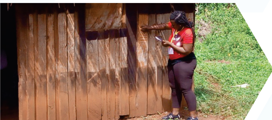
Identification du ménage après entretien à Yokadouma

Au terme de cette mission, un total général de 3139 mères et 2872 filles ont été interviewées à travers 150 villages parmi lesquels 100 abriteront les différents types d'interventions qui seront testées ultérieurement.