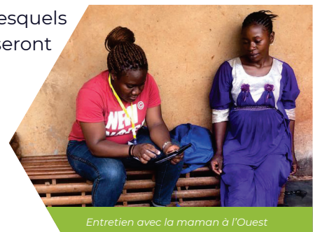
Entretien avec la maman à l'Ouest