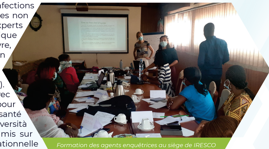
Formation des agents enquêtrices au siège de IRESCO

La pratique du repassage des seins est une pratique traditionnelle répandue au Cameroun qui consiste à masser ou presser ou scarifier les seins de la jeune fille dans le but de les empêcher de grossir rapidement. La justification de cette pratique repose sur la croyance qu'un sein aplati découragera l'attention masculine indésirable et les rapports sexuels à un très jeune âge, réduisant ainsi le risque de viols, d'infections sexuellement transmissibles, de grossesses non désirées et de mariages précoces. Les experts médicaux préviennent que cette pratique pourrait contribuer à l'infection, à la fièvre, aux lésions tissulaires et à la destruction complète des glandes mammaires, conduisant éventuellement au cancer du sein (Département d'État américain, 2010). Elle peut également interférer avec l'allaitement plus tard dans la vie. C'est pour faire face à cette pratique néfaste pour la santé des jeunes filles que IRESCO et Università Cattolica del Sacro Cuore en Milan ont mis sur pied le projet de recherche opérationnelle dénommé « Le repassage des seins, l'allaitement maternel et la mortalité infantile au Cameroun ».