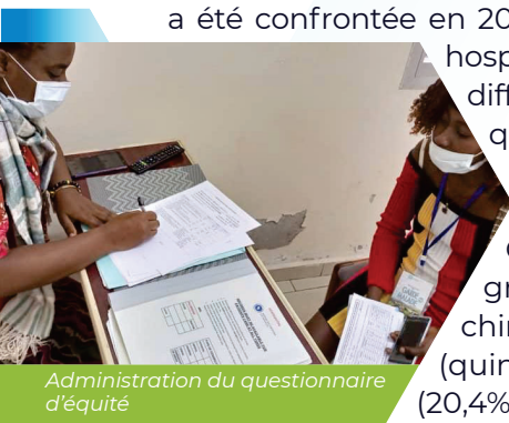
Administration du questionnaire d'équité